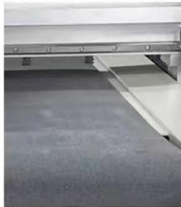
Imported guide rail