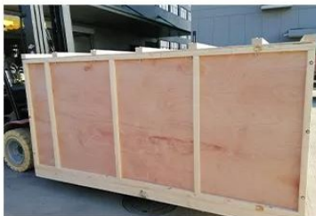
3.Transport to the vehicle by forklift