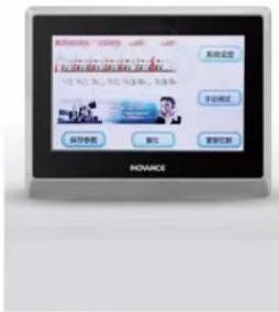
7 "super touch screen