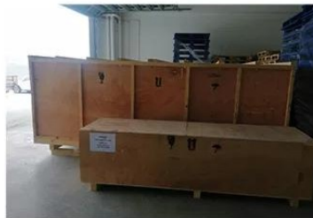
2.Packaged for transportation