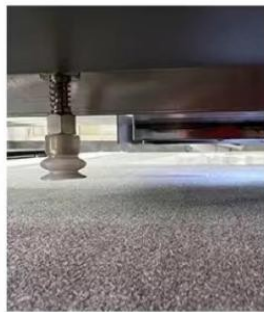
Suspension type paper suction cup